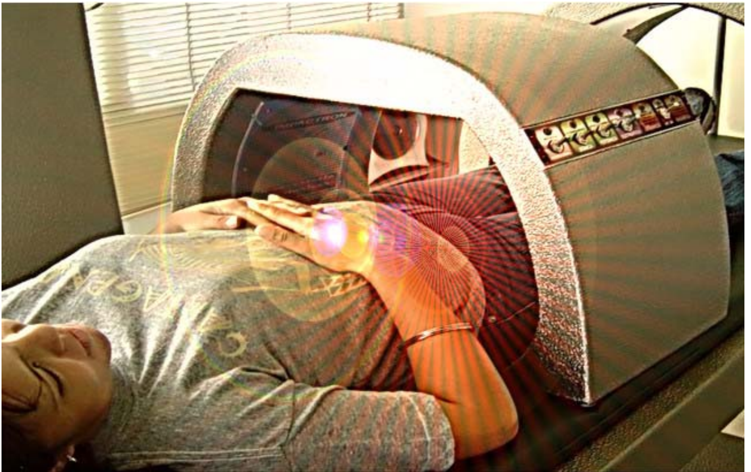
UNIDAD CROMOTERAPÉUTICA PORTATIL

Por tantas y tan evidentes razones, una acción inteligente es no quedarse quietos y mirar nuevos horizontes hasta encontrar profesionales de vanguardia, que han tomado la delantera y se han equipado con los más recientes aparatos de cuarta generación, en esta guerra contra la enfermedad — que no estamos dispuestos perder — ya que de nuestras decisiones correctas dependen nuestras vidas.